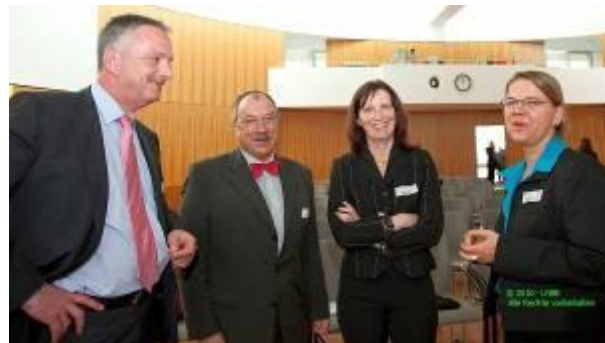
Branchenkonferenz: Green Logistics, 28.04.2010 (Potsdam)