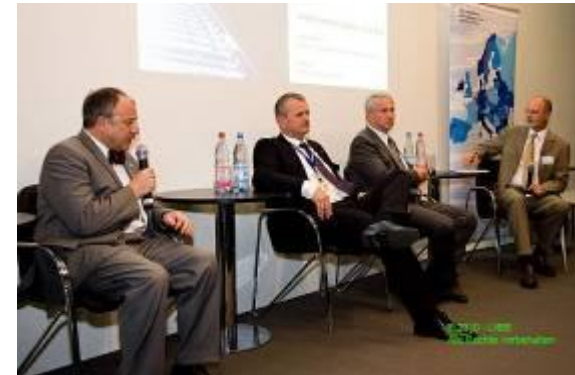
Aviation meets logistics, 08.06.2010