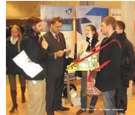
UniContact 2010, 19.01.2010 (Potsdam)