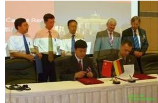
Kooperationsvereinbarung mit der den chinesischen Partnern aus Shenyang am 23.06.2010 in Shanghai (China)