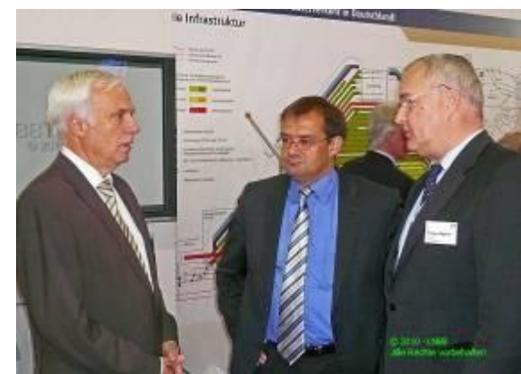
INNOTRANS 2010, 21.09.2010