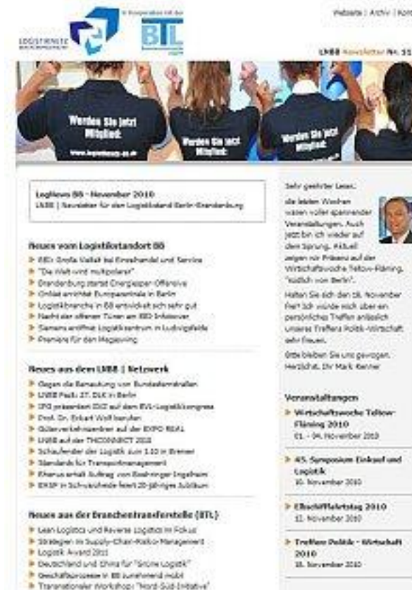
LNBB Newsletter im neuen Design