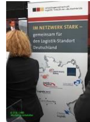
Tag der Dt. Einheit, 03.10.2010 (Bremen)