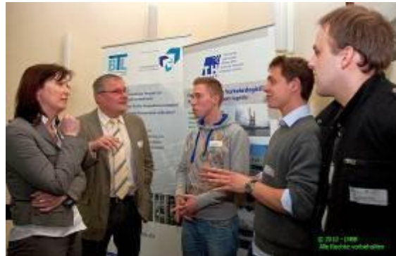
Tag der Logistik, TH Wildau, 17.04.2010