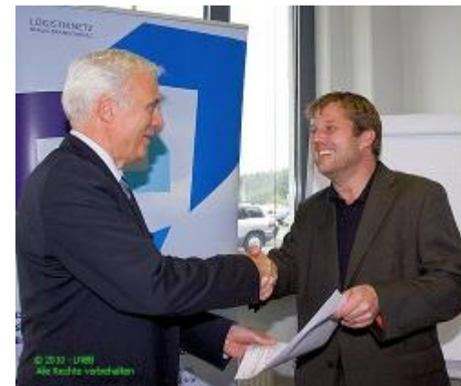
Kooperationsvereinbarung mit dem ADAC Fahrsicherheitszentrum BB, 09.09.2010