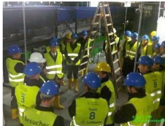
Gepäcklogistik – Außensequenz des LNBB zum 27. DLK 2010, 21.10.2010